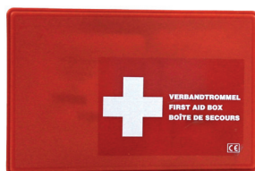
B TROMMEL 255416