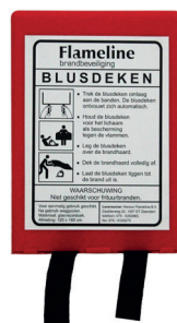
BLUSDEKEN 1.20M X 1.80M 561218